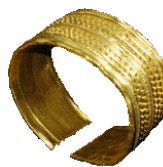
Bracelete em ouro